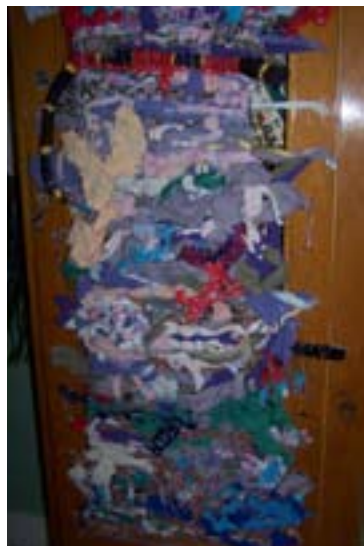
Začiatok tkanej tapisérie