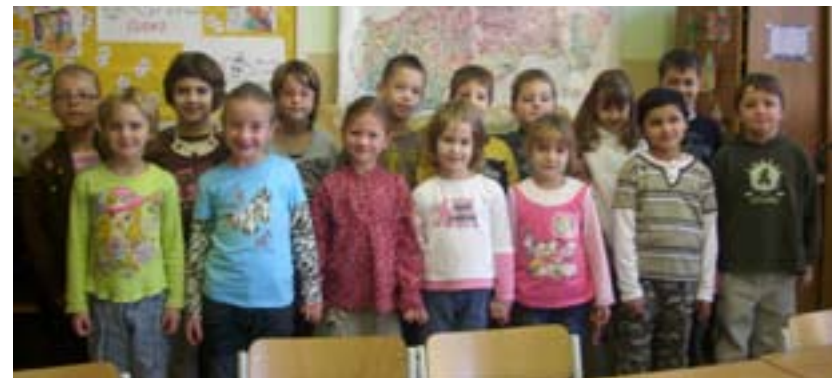
Usmievavé tváre našich najmenších