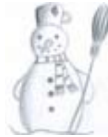
Kedy som krajší?