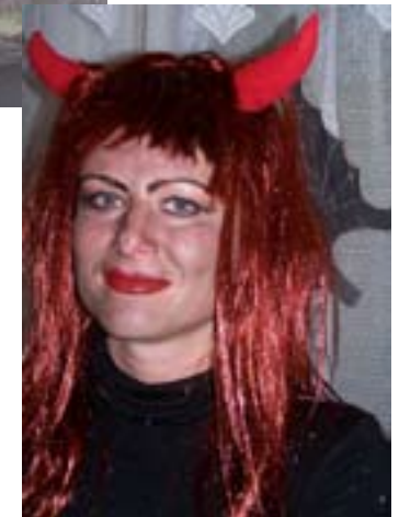
Naše fotografie nepotrebujú komentár. Všetky, a všetci na nich sú úžasní!!!