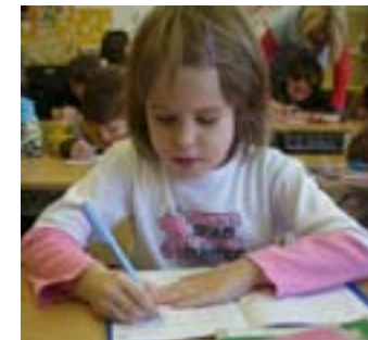
Písanie mám rada

M7: Ďakujeme za rozhovor a prajeme vám za úlohy samých smejkov.