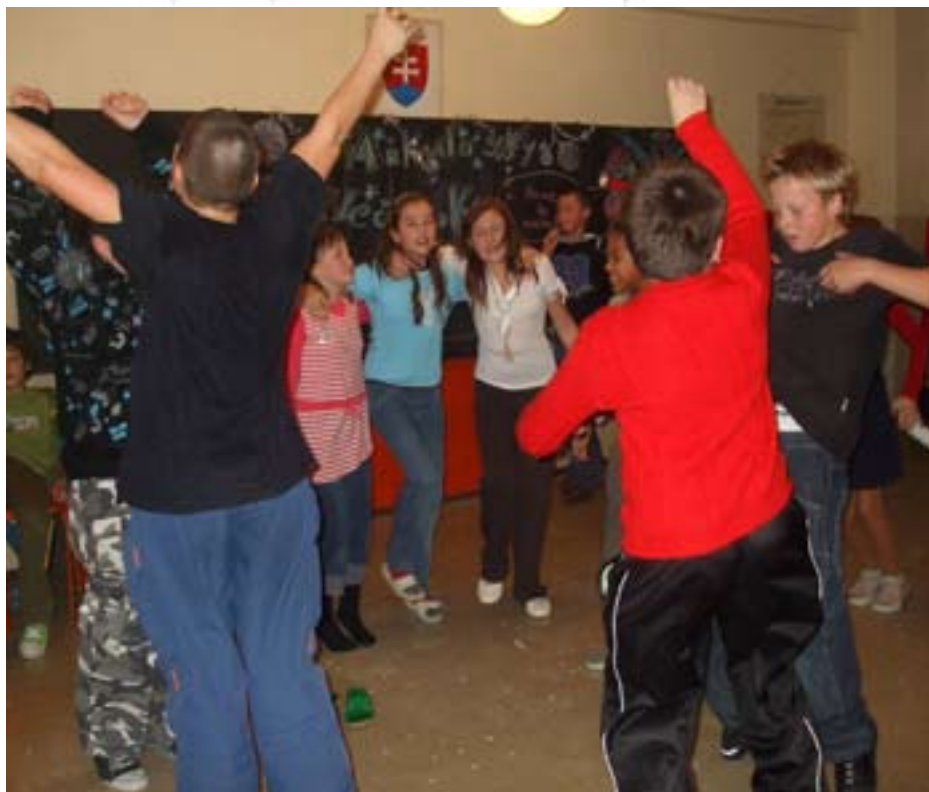
V Mikulášskom rytme