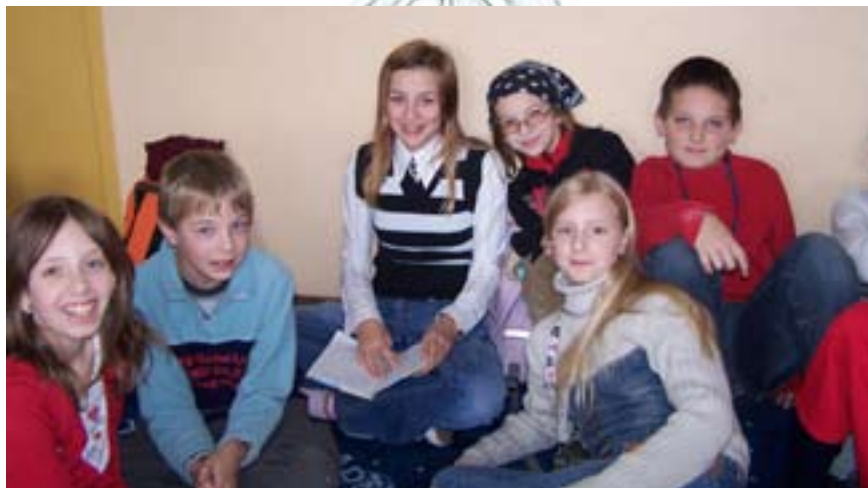
„Novinárka v televízii“